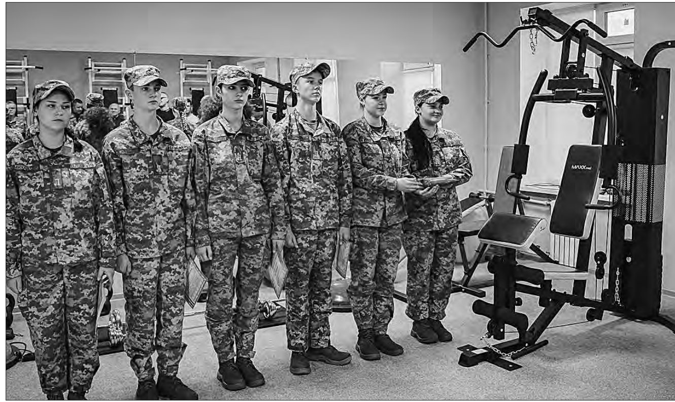
Ліцеїсти рівняються на Героя України.